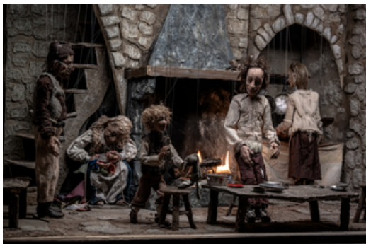
'Le Dernier Jour de Pierre' de la compagnie vaclusienne de marionnettes Deraïdenz