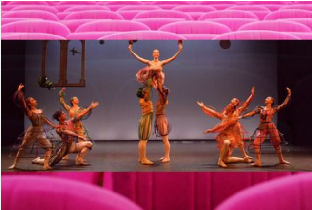
La Belle au Bois Dormant