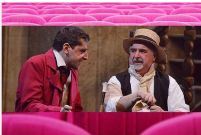
L'École des femmes