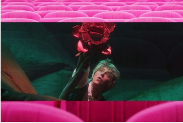
Le Petit Prince