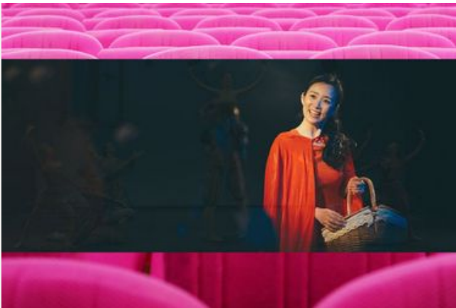
Le Petit Chaperon Rouge