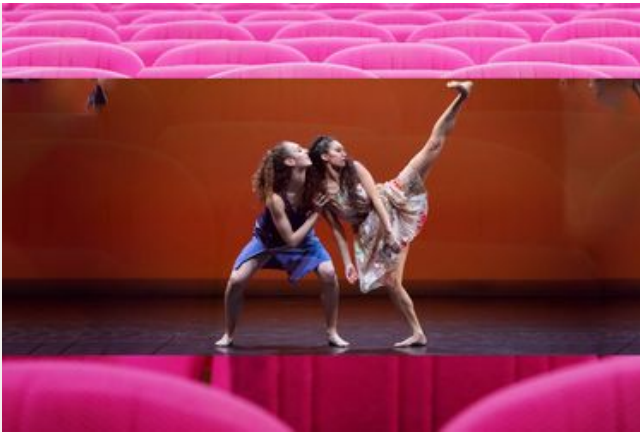
Danse au collège