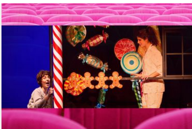
Hansel et Gretel