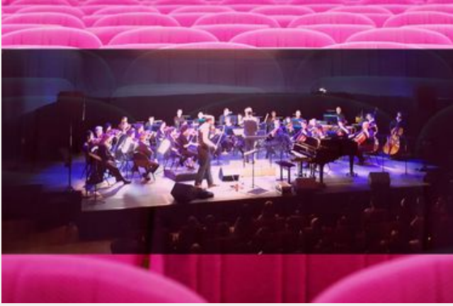
Collège au concert